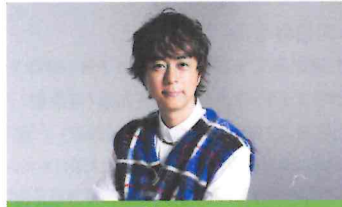
ヒヤダイン (音楽クリエイター)

「ボカロHプロジェクト」参加楽曲の中から1曲をヒヤダイン氏が編曲・プロデュース。 本名は前山田健一。京都大学を卒業後2007年に本格的な音楽活動を開始。アイドル、J-POPからアニソン、ゲーム音楽など多方面への楽曲提供、アーティスト、タレントとしても活動。 ※「VOCALOID(ボカロ)」および「ボカロ」はヤマハ株式会社の登録商標です。