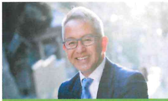
宮本亜門 (演出家・展覧会アンバサダー)

宮本亜門氏がファシリテートする人生ドラマワークショップドキュメンタリー映像上映。 演出家。2004年には東洋人初の演出家としてオンブロードウェイにて「太平洋序曲」を上演し、同作はトニー賞4部門にノミネート。ミュージカル、ストレートプレイ、オペラ、歌舞伎などジャンルを問わず幅広く作品を手掛ける。