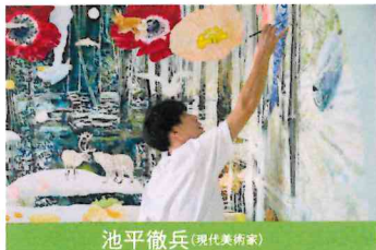
池平徹兵 (現代美術家)

ひきこもり当事者がワークショップで描いた絵をコラージュし大型油絵作品として展示。 2013年、第16回岡本太郎現代芸術賞展入選。オペラシティアートギャラリー「project N」、2017年、VOCA 展選出。小学校や福祉施設でのワークショップ形式による作品を発表。2023年パークホテル東京のアーティストルーム制作。