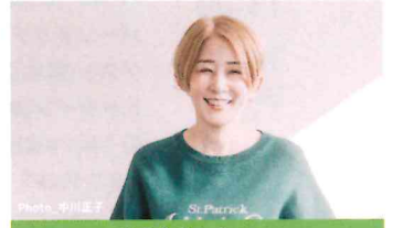
ひうらさとる (漫画家)

「ボカロHプロジェクト」参加楽曲の中から1曲をヒヤダイン氏が編曲・プロデュース。 本名は前山田健一。京都大学を卒業後2007年に本格的な音楽活動を開始。アイドル、J-POPからアニソン、ゲーム音楽など多方面への楽曲提供、アーティスト、タレントとしても活動。 ※「VOCALOID(ボカロ)」および「ボカロ」はヤマハ株式会社の登録商標です。