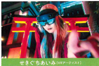
せきぐちあいみ (VRアーティスト)

ひきこもり経験者と共にVR体験会を実施し「夢」をテーマにVR作品を制作。 2016年からVR空間に3Dの絵を描くアーティストとして活動。アート制作やライブイベントオファーを世界各国から受ける。ヴェネチア国際映画祭のVR部門、2021年「Forbes Japan 100」に選出される。