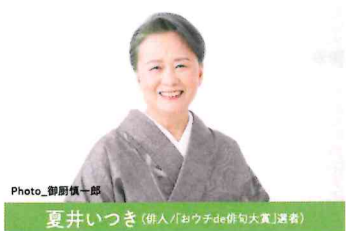
夏井いつき (俳句「おウチde俳句大賞」選者)

「第5回おウチde俳句大賞(朝日出版社)」とのコラボ企画で夏井いつき氏が選出した俳句を展示。 俳句集団「いつき組」組長。創作活動に加え、俳句の採集(句会ライブ)、「俳句甲子園」の創設にも携わるなど幅広く活動中。TBS系「プレバト!!」俳句コーナー出演などテレビラジオでも活躍。