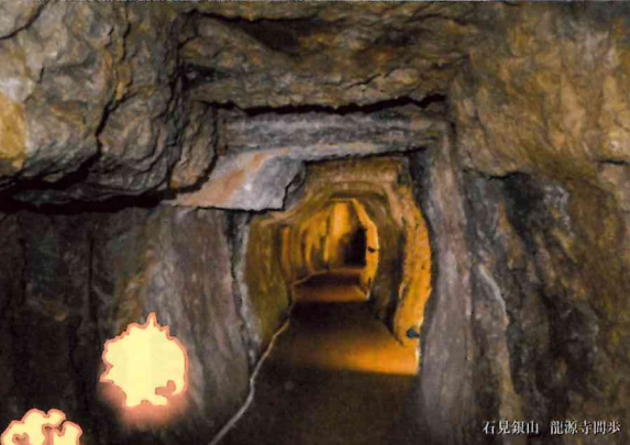
石見銀山 龍源寺開基