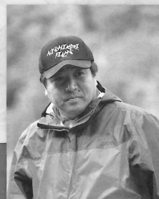
第2日目 記念講演 講師