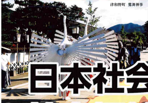
津和野町 鶯舞神事