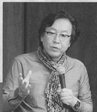
第1日目 基調講演 講師