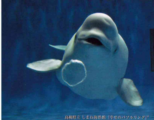
高根県立しまね海洋館「幸せのハアブルリング」

いのち・権利・暮らしをまもり、 支えるソーシャルワーク ～人と地域をつなぐ縁結び社会へ～